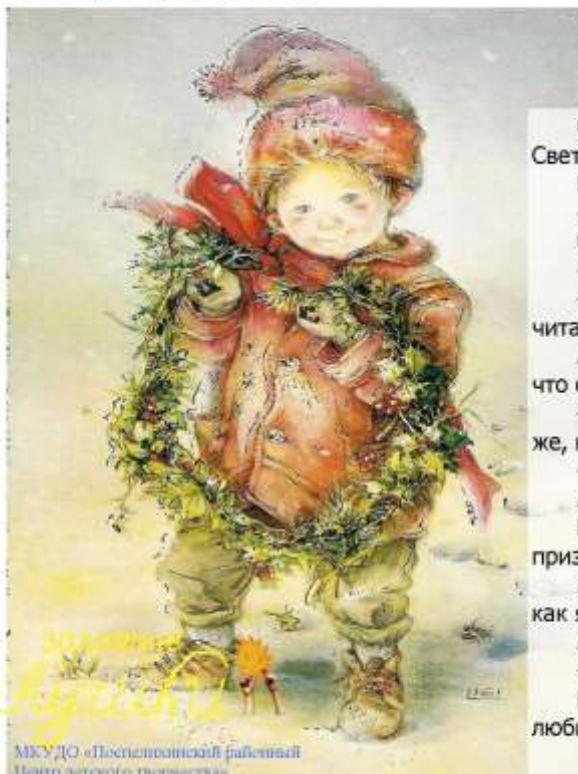
МКУДО «Поспеловский районный Центр детского творчества»